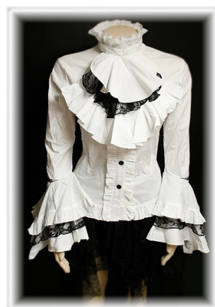
Camicia n.7 Stile ottocentesco