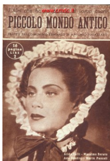
Film Piccolo mondo antico, 1941 Interpreti: Alida Valli, Massimo Serato