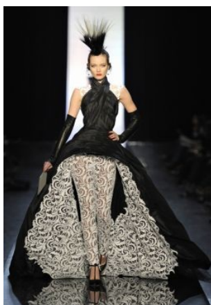
Abito n°5 Gaultier Jean Paul