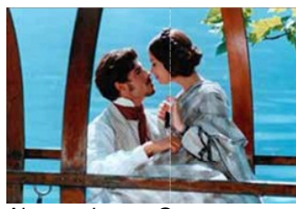
Alessandro Gassman e Claudia Pandolfi, 2007 Telefilm: Piccolo mondo antico Foto n°2