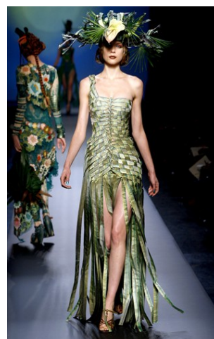
Abito n. 4 Gaultier Jean Paul