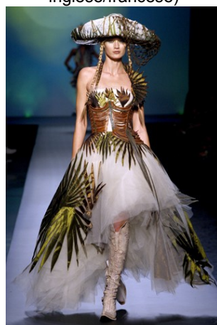
Abito n. 7 Gaultier Jean Paul