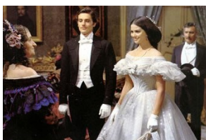
Alain Delon e Claudia Cardinale