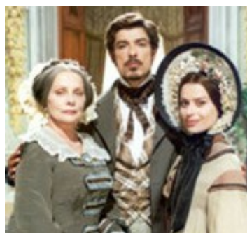
Alessandro Gassman, Pandolfi e Virna Lisi Telefilm: Piccolo mondo antico Foto n°1