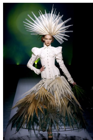
Abito n. 8 Gaultier Jean Paul