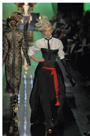
Abito n. 3 Gaultier Jean Paul (da descrivere in lingua inglese/francese)