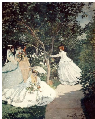
Figura 4 Claude Monet, Donne in giardino, 1866 circa, olio su tela, Musée d'Orsay, Parigi