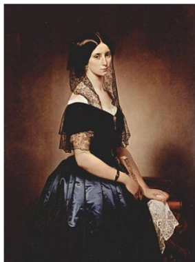
Figura 1 Francesco Hayez Ritratto di Antonietta Tarsis Basilico 1851 olio su tela Roma, Collezione privata