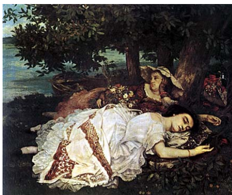
Figura 5 Courbet, Le signorine sulla riva della Senna, 1857, olio sulla tela, Musée d'Orsay, Parigi