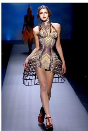
Abito n. 6 Gaultier Jean Paul