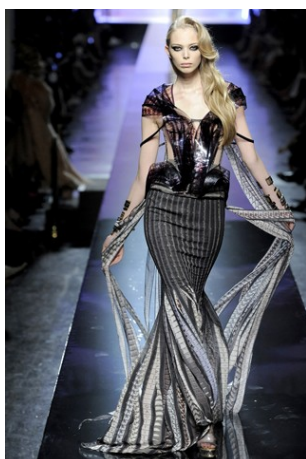
Abito n. 2 Gaultier Jean Paul