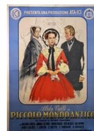
Locandina Piccolo mondo antico