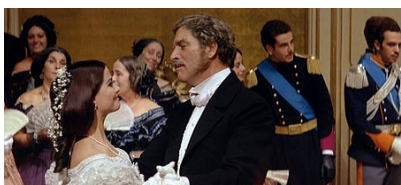
Burt Lancaster e Claudia Cardinale nella famosa scena del ballo